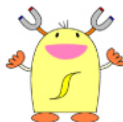
マスコットの ジッキーです！